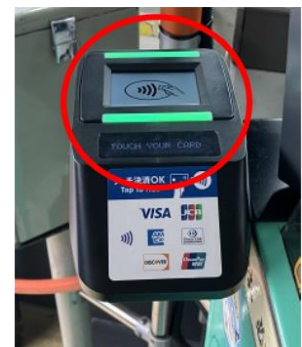
料金箱付近のリーダー