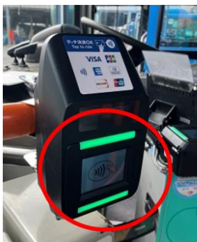
ドア付近のリーダー