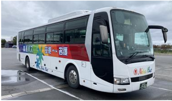
【那覇バスが運行する路線バス】