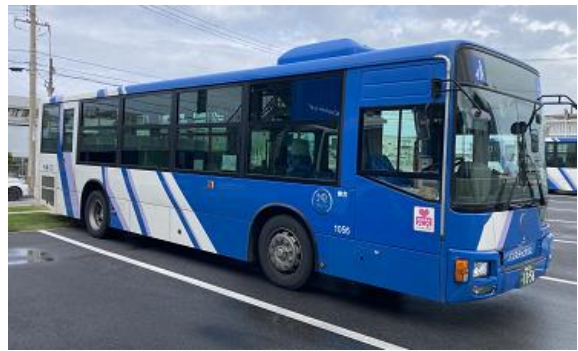
【沖縄バスが運行する路線バス】